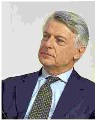
Ferruccio De Bortoli